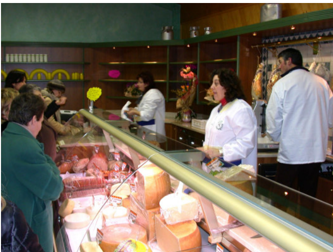
Locale Vendita: Formaggi & Salumi