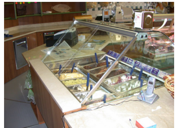
Locale Vendita: Gelato