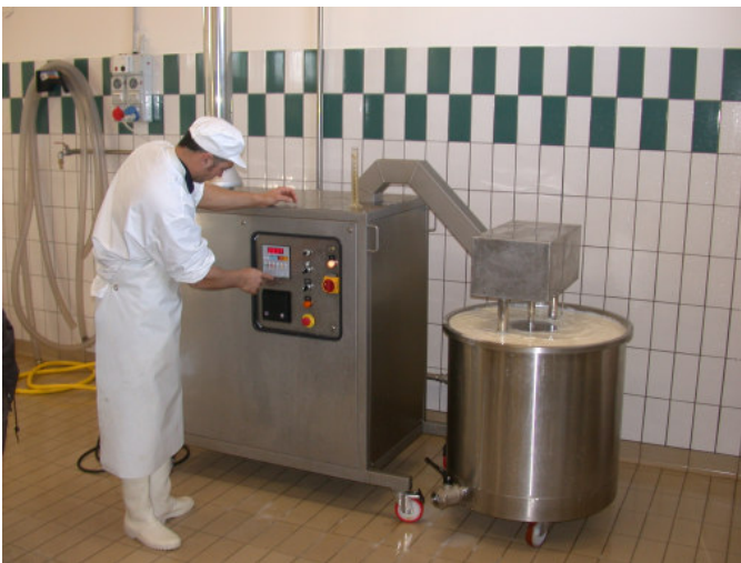
Polyfood in opera